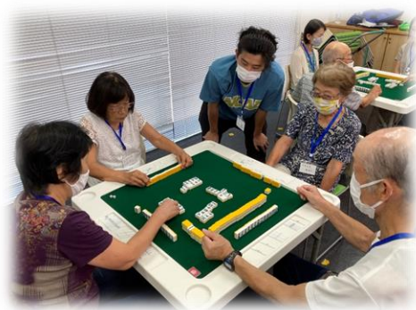
初心者にはマンツーマンで指導