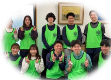
桐蔭横浜大学尾山研究室の学生