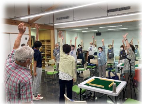
休憩中は体操でリラックス！