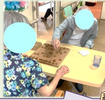
対局は真剣勝負です