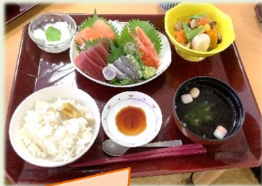
栗ごはんとお刺身御前は 「おいしい～!」と大盛況でした