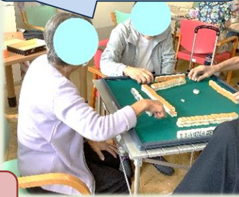
昔、家族でやった 麻雀を思い出すわ～