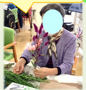
お花のアレンジを 楽しんでいます