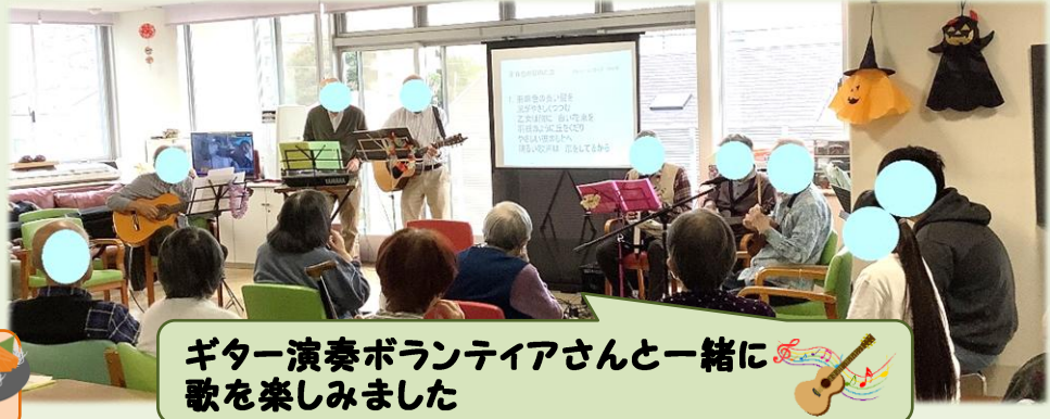
ギター演奏ボランティアさんと一緒に 歌を楽しみました